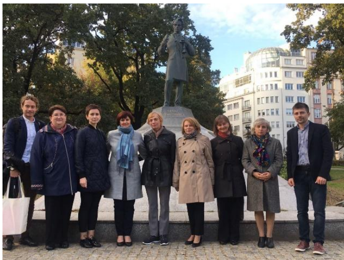
Uczestnicy konferencji.