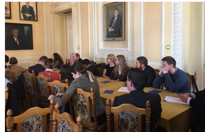
Inauguracja roku akademickiego 2018/2019.

Dnia 1 października 2018 roku w Pałacu Staszica w Warszawie odbyła się uroczysta inauguracja roku akademickiego 2018/2019 Studiów Doktoranckich w Instytucie Sławistyki Polskiej Akademii Nauk. Studia Doktoranckie w IS PAN mają już długą, siedemnaścieletnią tradycję.